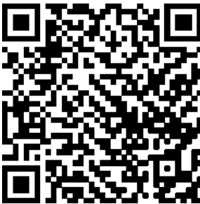
مستند دوره ششم مسابقات